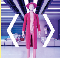
Visual Merchandiser/in Lifestyle STF