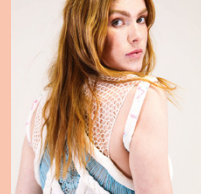
Knitwear Spezialist/in STF