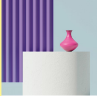
Farbdesigner/in STF (Vorbereitungskurs für BP)