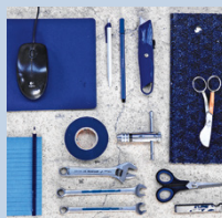
Schicht- & Gruppen-leiter/in STF