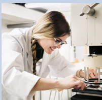
Dipl. Textil- und Ver-fahrenstechniker/in HF