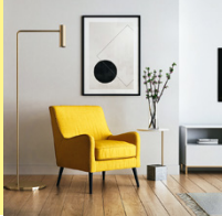
Dipl. Kommunika-tionsdesigner/in HF