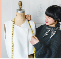
Fashion Spezialist/in STF (Vorbereitungskurs für BP)