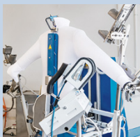
Textile Care Spezialist/in STF & VTS