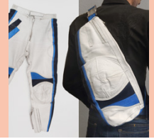
Sustainable Accessory Designer/in STF