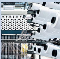
Technologiespezialist/in Textil STF (Vorbereitungskurs für BP)