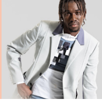
Fashiondesigner/in STF (Vorbereitungskurs für HFP)