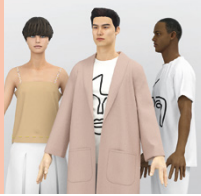
Dipl. Textil- und Bekleidungs-techniker/in HF