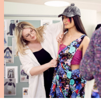
Fashion Stylist/in STF