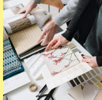
Interior Designer/in STF