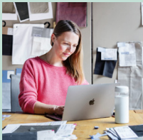
Dipl. Textil- und Fashionmanager/in HF